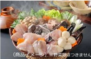
(商品イメージ) ※野菜類はつきません