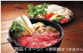
(商品イメージ) ※野菜類はつきません