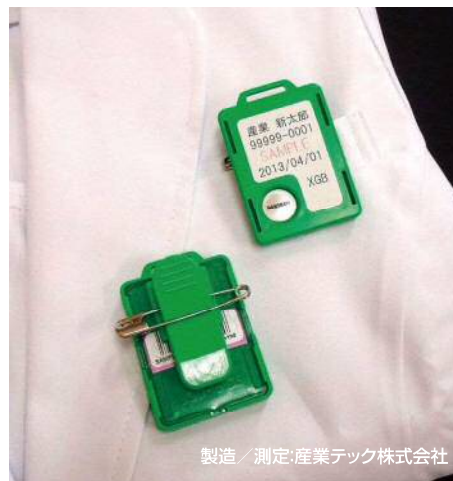
製造/測定:産業テック株式会社