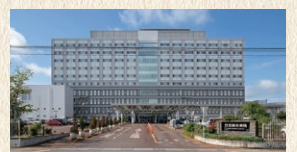
竹田綜合病院 徒歩8分(約622m)