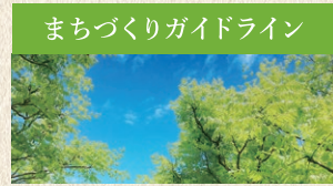
まちづくりガイドライン

エムズスクエア新横町では、美しい景観を守り育てる「まちづくりガイドライン」を制定。美しいまちづくりを実現することで将来より資産価値の高いまちへと成長することをめざします。