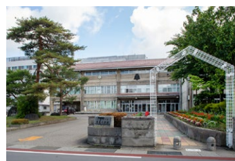
会津若松市立 謹教小学校