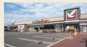
ヨークベニマル 城西町店 徒歩10分(約736m)