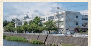
城西小学校 徒歩3分(約221m)