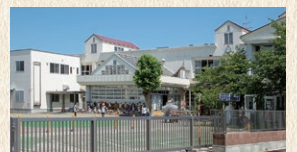
会津若葉幼稚園 徒歩6分(約465m)