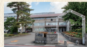
謹教小学校 徒歩9分(約652m)