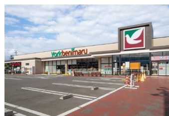
ヨークベニマル城西町店