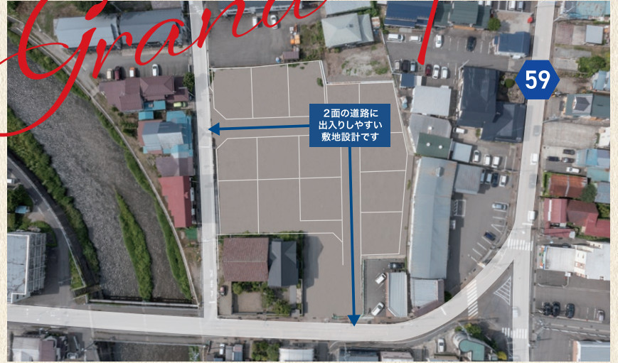
※区画イメージはドローン写真に加工を施しています。実際と多少異なります。※2022年6月30日撮影