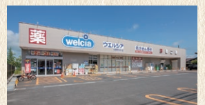
ウエルシア 会津若松湯川店 徒歩8分(約623m)