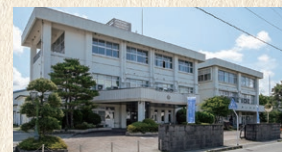
第三中学校 徒歩5分(約374m)