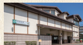
JR只見線 西若松駅 徒歩10分(約756m)